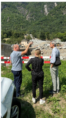
Giudicetti con Catena della Solidarietà, Sorte, 24.07.24

Resp. Comunicazione Gr. Coordinamento Reg.